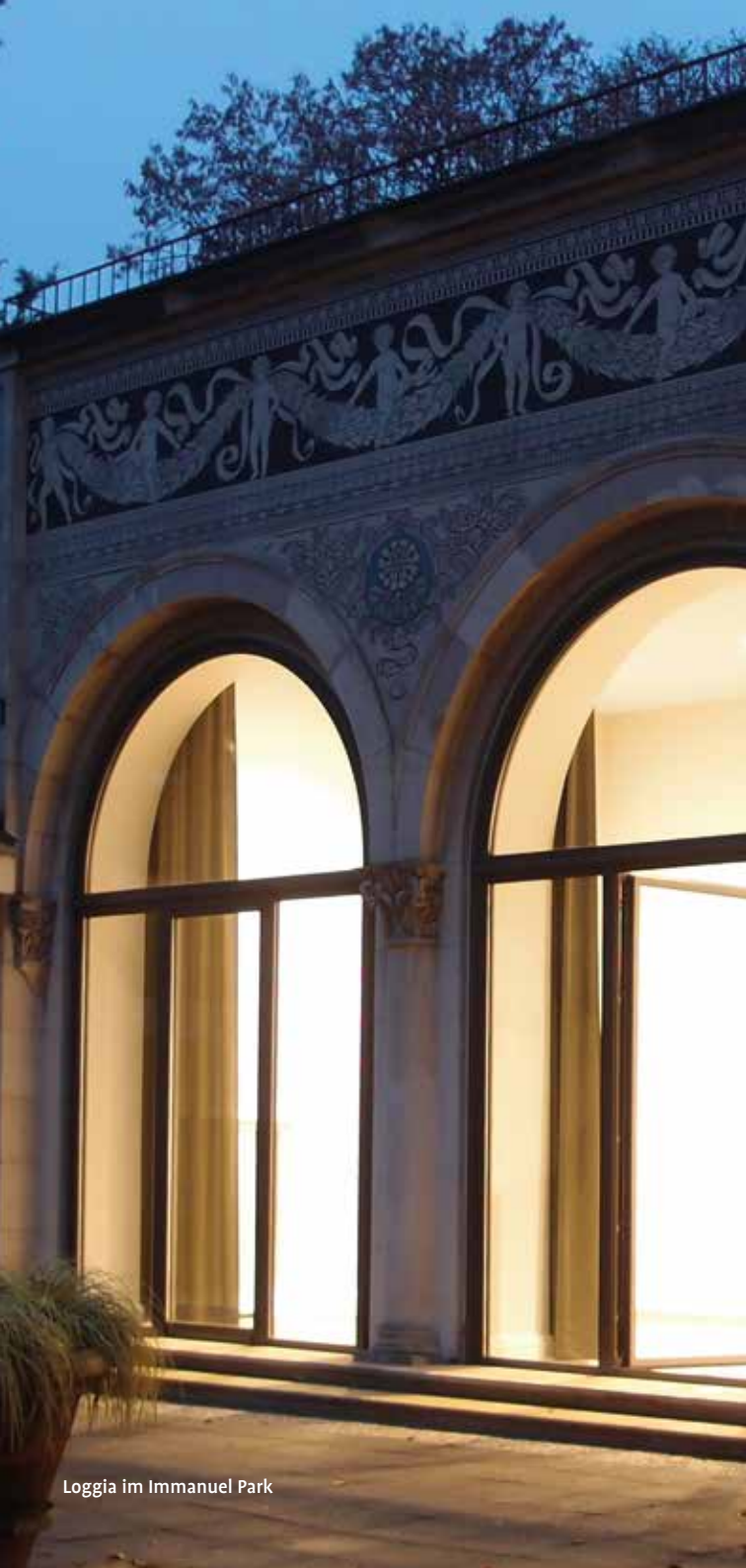
Loggia im Immanuel Park